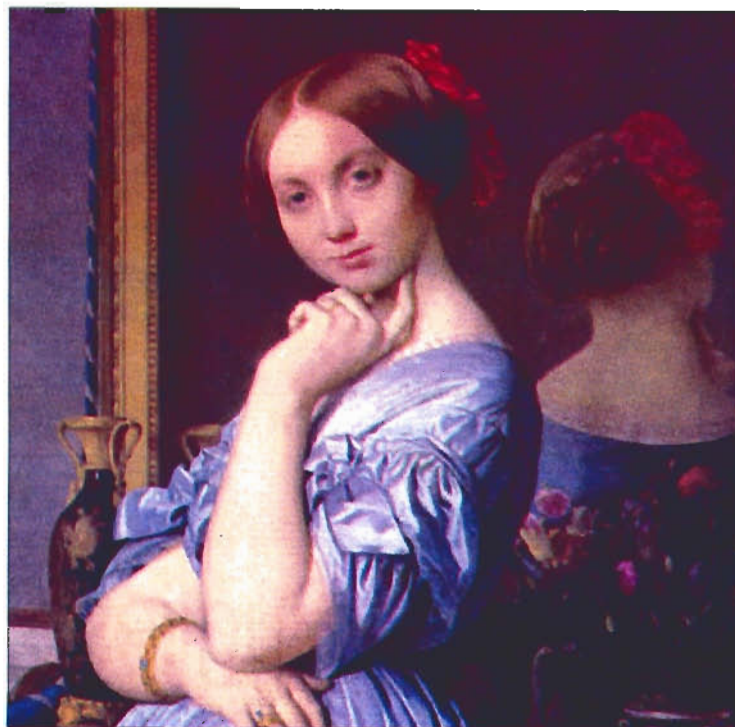
Un dipinto ispirato alla celebre opera

E' tutto pronto presso il teatro dell'istituto Giovanni Pascoli, per la messa in scena de "La Serva Padrona", il celebre intermezzo buffo in due atti di Giovan Battista Pergolesi, composto su libretto di Gennaro Antonio Federico. L'appuntamento, dunque, è per questa sera alle 21 nello stabile di via delle Palme ad Aprilia. L'opera può, a ragione, essere considerata l'esordio dell'opera buffa italiana. L'associazione culturale "Diapason" di Aprilia, dunque, ha deciso di mettere in scena, per la prima volta nella sua decennale esperienza, una rivisitazione di questa opera. La regia è dell'associazione così come la cura completa della messa in scena e di ogni particolare. L'evento gode