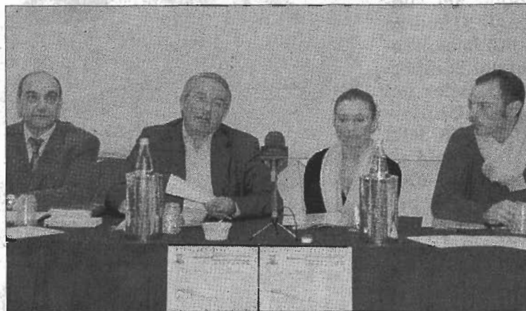
La conferenza stampa di presentazione dell'evento

Il finanziamento della Provincia di Latina, seppur esiguo per eventi del genere, ha permesso di allestire anche ad Aprilia uno spettacolo di opera lirica. Presentata in conferenza stampa ieri mattina, in città il 6 novembre andrà in scena «La Serva Padrona», il celebre intermezzo buffo in due atti di Giovan Battista Pergolesi composto su libretto di Gennaro Antonio Federico. L'opera può, a ragione, essere considerata l'esordio dell'opera buffa italiana. L'associazione culturale Diapason di Aprilia ha deciso di mettere in scena, per la prima volta nella sua decennale esperienza, una rivisitazione de La Serva Padrona. La regia